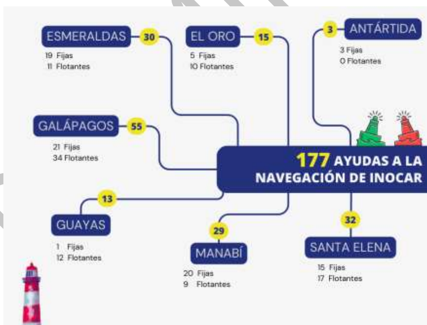
Ilustración 3. Distribución de las ayudas a la navegación de INOCAR por provincias costera y la Antártida.

En su rol estratégico en la seguridad marítima nacional, el INOCAR, ejecutó trabajos de mantenimiento preventivo, correctivo y emergente en las 177 ayudas a la navegación distribuidas a nivel nacional en las provincias de Esmeraldas, Manabí, Santa Elena, Guayas, El Oro, Galápagos y a nivel internacional en la Antártida, garantizando condiciones seguras para el tráfico marítimo y fortaleciendo la presencia del Estado en los espacios marítimos y antárticos.