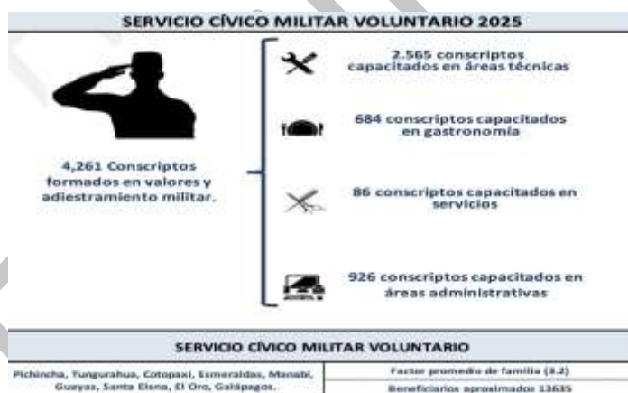
Ilustración 6. Beneficiarios del SCMV

El Servicio Cívico Militar Voluntario (SCMV) constituye una contribución estratégica de las Fuerzas Armadas al desarrollo del país, al combinar la instrucción militar, la formación en valores y la capacitación técnica de los jóvenes ecuatorianos en servicio a la patria. Durante el año 2025, se capacitaron 4.252 conscriptos, quienes participaron en 204 cursos organizados en cuatro áreas: técnicas, gastronomía, servicios y administrativas. La estimación de beneficiarios se realizó considerando el promedio de integrantes de una familia ecuatoriana en 2025, que según el Instituto Nacional de Estadísticas y Censos fue de 3,2 personas, lo que implica que cada conscripto capacitado impacta directamente en el bienestar de su núcleo familiar.