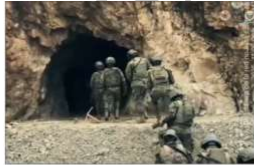
Tabla 34. Resultados contra la minería ilegal en la Provincia del Azuay