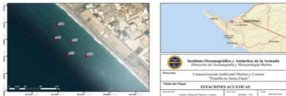
Ilustración 5. Mapa de caracterización ambiental Elaboración: Instituto Oceanográfico y Antártico de la Armada.

Este trabajo contempló la recolección y procesamiento de diversas muestras y datos, cuya sistematización permitió la elaboración de un informe técnico acompañado de mapas de caracterización ambiental. Los resultados derivados de estos estudios fueron difundidos por el INOCAR de forma periódica a través del boletín informativo “Conciencia Azul”.