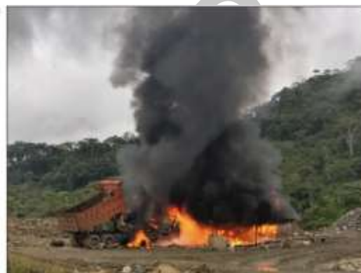
Tabla 36. Operaciones contra la minería ilegal en la Provincia de Morona Santiago