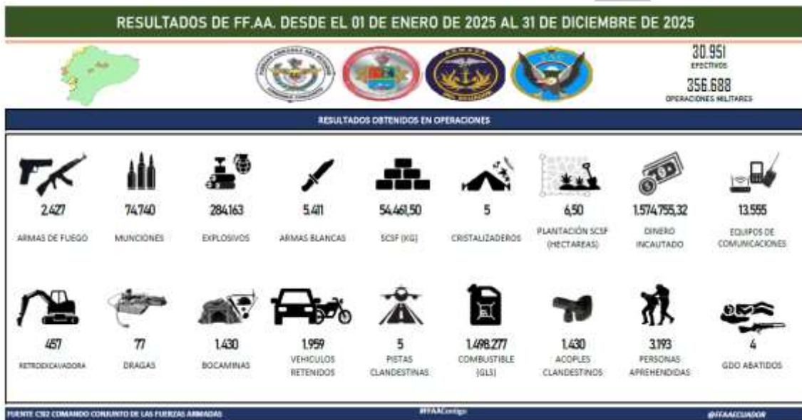
Ilustración 2. Resultados de las operaciones de FF.AA en el 2025

El direccionamiento de estas operaciones fue plasmado en el Plan Estratégico Institucional, que contiene cinco Objetivos Estratégicos Institucionales (OEI), alcanzando a nivel nacional los resultados más relevantes, de acuerdo con sus objetivos y con 4 ejes (narcotráfico, minería ilegal, sustracción y comercialización ilegal de hidrocarburos, tráfico de armas, municiones y explosivos), de los cuales obtienen financiamiento los grupos armados organizados (GAO), detallados en la Ilustración 2: