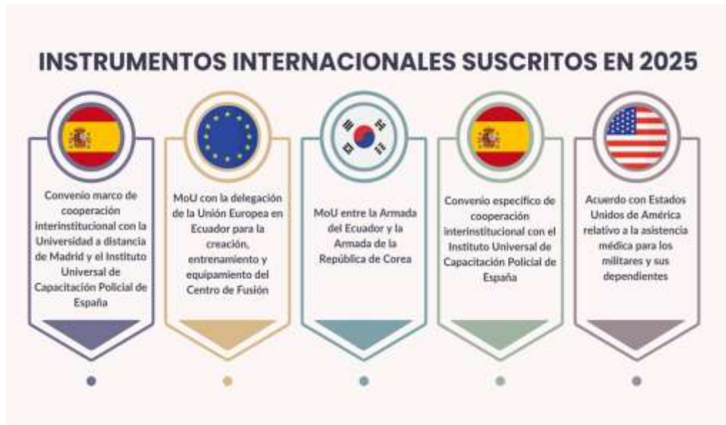
Ilustración 8. Instrumentos internacionales firmados en el 2024