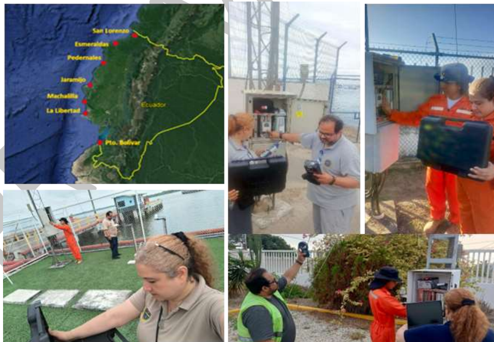
Ilustración 4. Monitoreo de condiciones adversas en estaciones meteorológicas automáticas continentales

Adicionalmente, elaboró 36 reportes de accidentes, 8 informes oceanográficos, se atendieron 16 solicitudes de información y se validaron 37 estudios técnicos, fortaleciendo el soporte a la toma de decisiones y la gestión en el ámbito marítimo.