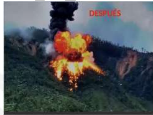
Tabla 32. Resultados contra la minería ilegal en la Provincia de Imbabura