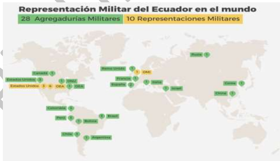
Ilustración 10. Representación militar del Ecuador en el Mundo

Para el año 2026, el Ministerio de Defensa Nacional proyecta consolidar una política de relacionamiento internacional más estratégica, articulada y orientada a resultados, que fortalezca el posicionamiento del Ecuador como un actor confiable y comprometido con la seguridad y defensa regional y global. En este marco, se priorizará la profundización de alianzas con países estratégicos y organismos internacionales, optimizando los mecanismos de cooperación bilateral, vecinal y multilateral, con un enfoque focalizado en la transferencia de capacidades, innovación tecnológica y fortalecimiento operativo de las Fuerzas Armadas.