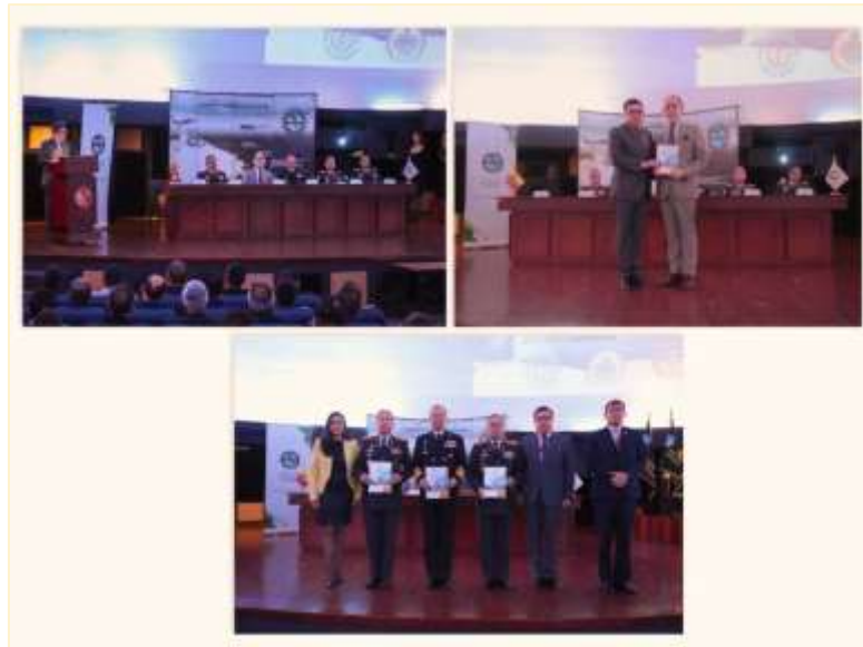
Ilustración 7. Lanzamiento del Plan de implementación del Sistema de I+D+i+P del sector Defensa.