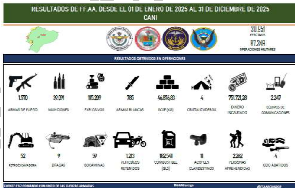
Ilustración 12. Resultados de las operaciones realizadas en atención al Decreto 110 y 218 Ene-Dic 2025

En el año 2025, los decretos establecidos permitieron ejecutar 87.349 operaciones militares en el ámbito interno, empleando 30.951 miembros de las Fuerzas Armadas a nivel nacional, cuyos resultados reflejan una degradación significativa de las capacidades logísticas y financieras de las organizaciones criminales.