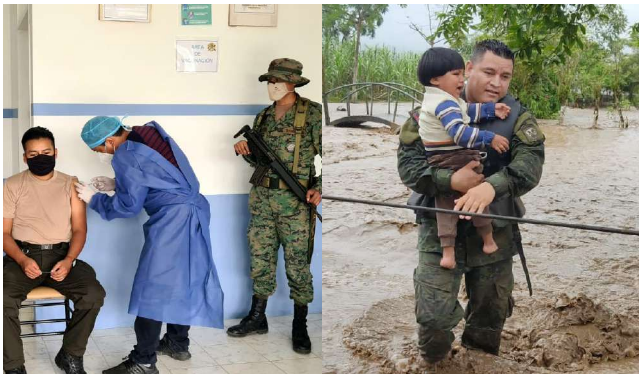
Tabla 10. Apoyo a la ARCERNNR