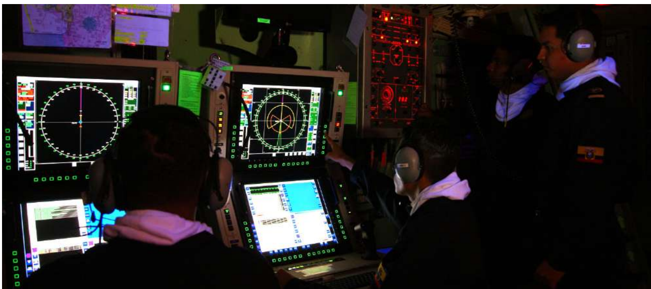
Tabla 4. Operaciones de ciberdefensa ejecutadas en el 2022