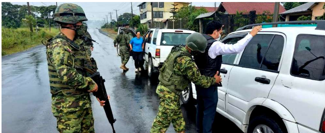
Tabla 1. Operaciones y resultados obtenidos de la vigilancia y control terrestre en el 2022