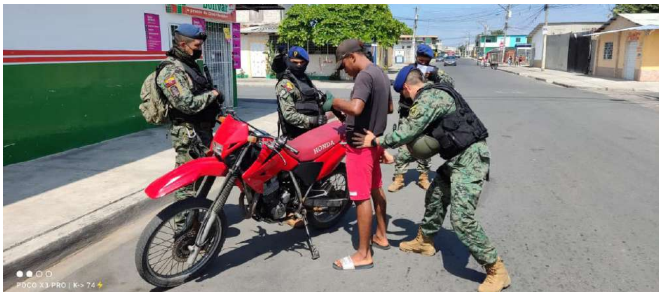
Tabla 5. Operaciones y resultados del Control de Armas, municiones y explosivos (CAMEX).