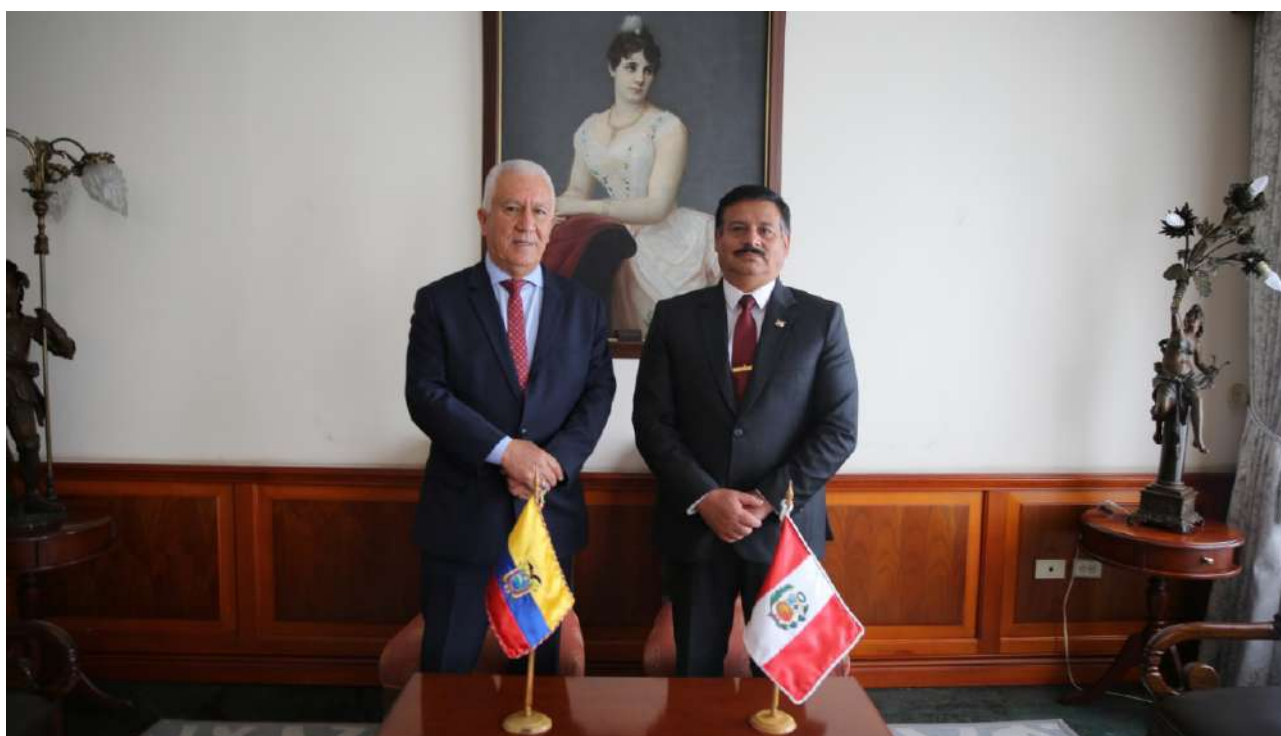
Tabla 24. Asuntos internacionales en el ámbito vecinal con la República de Perú

Las actividades realizadas con la República del Perú son detalladas en la Tabla 24.