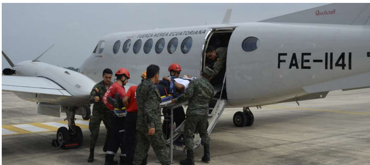
Tabla 3. Operaciones y resultados obtenidos de la vigilancia y protección del espacio aéreo