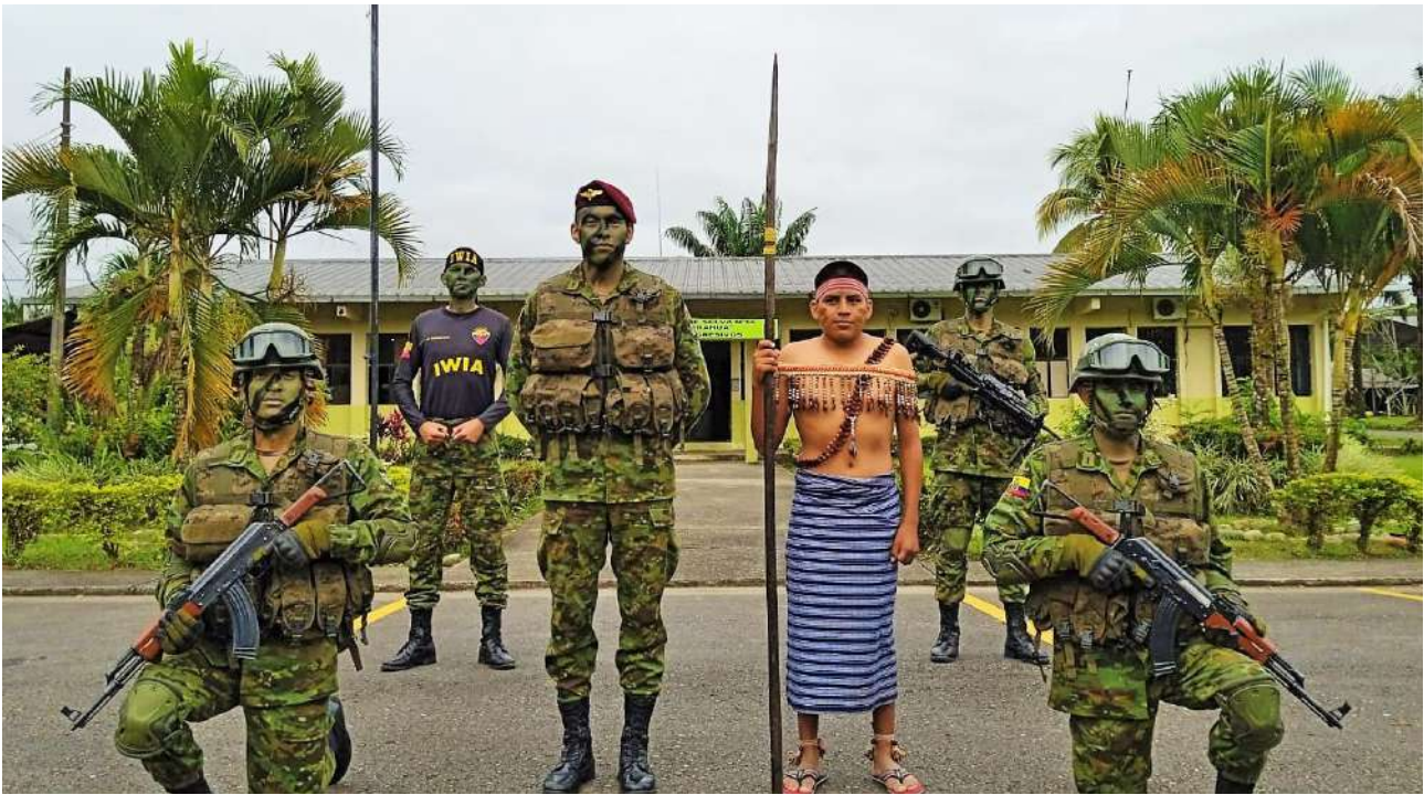
Tabla 30. Ingreso de aspirantes a escuelas de formación de FF. AA por etnias y nacionalidades